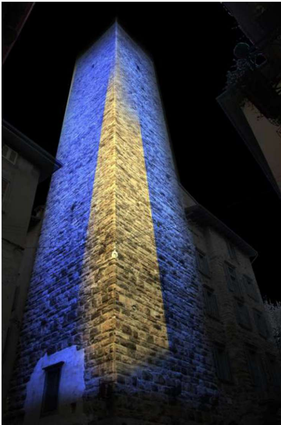
Progetto scenografico di Sebastiano Romano per la Torre del Gombito, Bergamo

Oltre agli interventi di illuminazione scenografica l'azienda celebrerà il suo 40° compleanno all'interno di Casa Suardi – sede dell'Ateneo in Piazza Vecchia – con altre due iniziative che promuovono la "cultura della luce" : una mostra che racconta il MoMS – il nuovo museo dedicato al "Modern Show lighting" , realizzato da Clay Paky presso la propria sede a Seriate (BG) – e la proiezione dei filmati vincitori delle tre edizioni del concorso video internazionale "Riprenditi la città, Riprendi la luce" , organizzato da AIDI con il supporto economico dell'azienda bergamasca, dove i giovani under 30, con un loro video di 60 secondi, hanno raccontato la luce e le città.