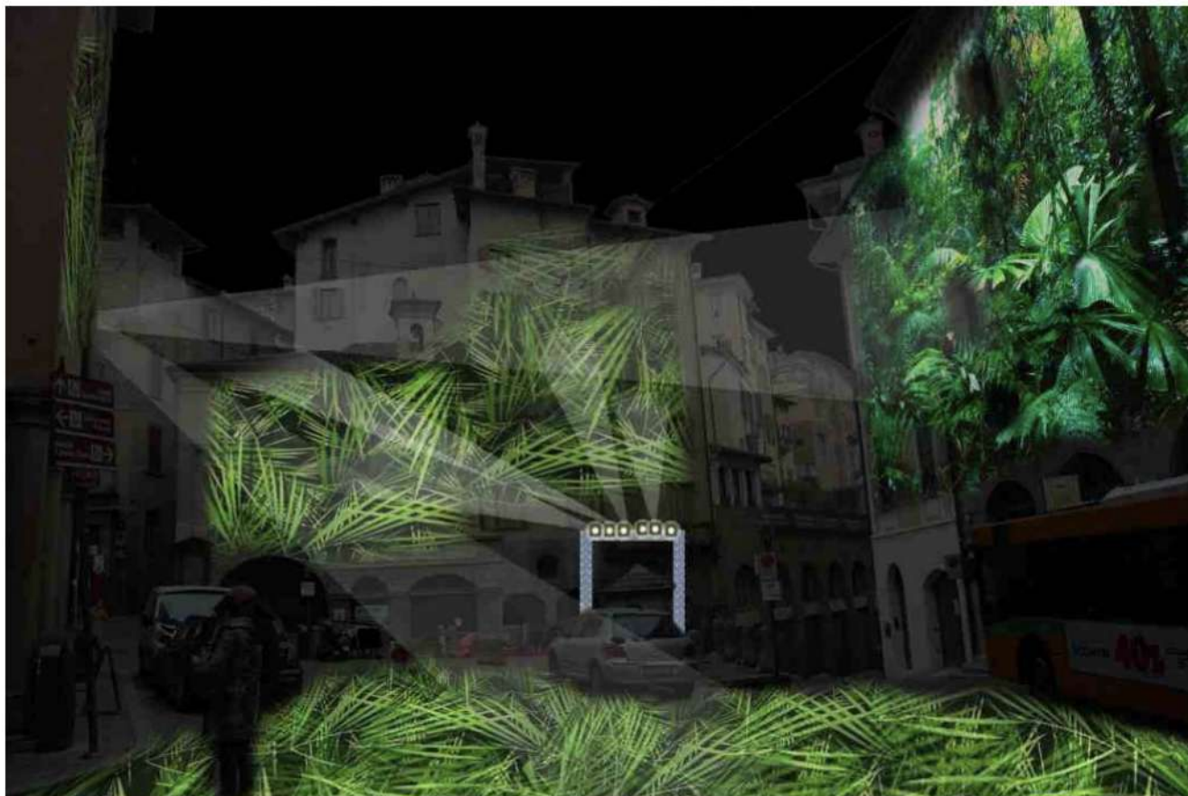
Progetto scenografico di Sebastiano Romano per Piazza Mercato delle Scarpe, Bergamo

La mostra e le proiezioni saranno aperte al pubblico tutti i giorni, dal 7 al 25 settembre, dalle 09.30 alle 18.30 con orario continuato.